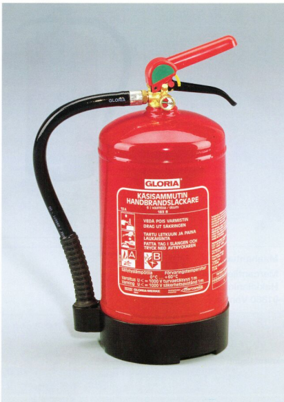
S 6 DLWB